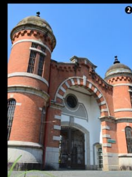
②③ 表門の玉葱頭の門柱が美しい、上部の白所は石灰岩を使っているのだろう。④ 門扉のデザインも美しい。⑤ その門扉の隙間にレンズを差し込んで撮影。庁舎は煉瓦造り2階建て、煉瓦葺の屋根で、中央に青緑色の尖塔がある。