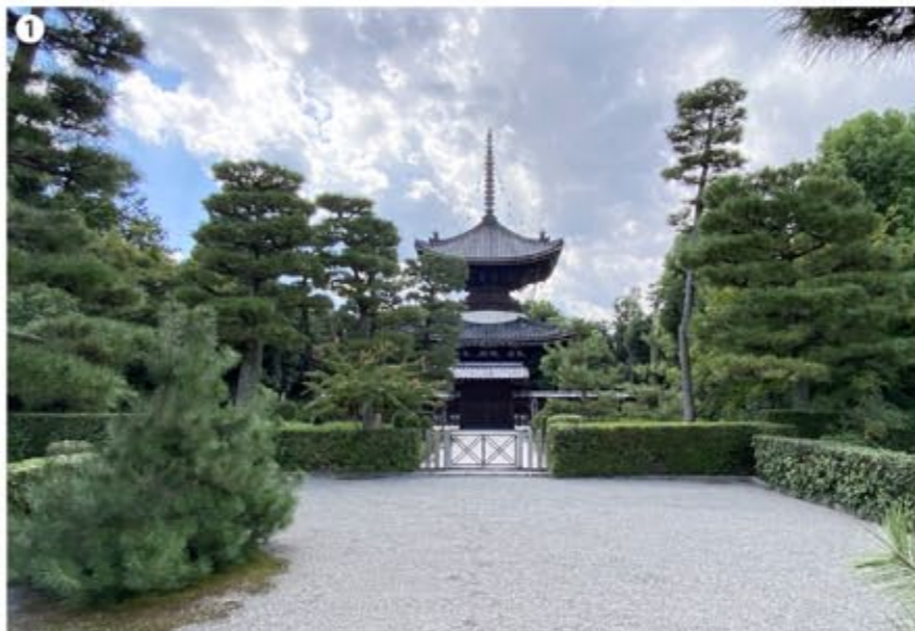
1 これが天皇陵唯一の「多宝塔」、これまでの御陵のイメージとまったく違う！

その御陵は、鳥羽法皇が皇后の藤原得子(美福門院)の墓所・三重塔として建てたものだったが、皇后の遺言通りに遺骨は高野山に納められた。からの三重塔に(何も納められていない)、崩御より八年後(一一六三年)近衛天皇の遺骨をここに移した。当初は三重塔であったが、一五九六年の慶長伏見地震の被害で倒壊、豊臣秀頼の命により多宝塔として再建された。形式では「多宝塔」で、これは歴代天皇陵では唯一である。