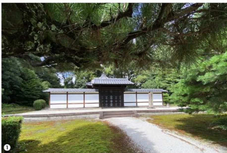
① 堂形の御陵は初めてだ、江戸に改修させただけあり近代的に感じる(笑)。

七三代・堀河天皇の皇子。生後間もなく母の「故子」が没し、祖父の白河法皇(七二代・天皇)の元に引き取られ養育された。誕生七か月で立太子、父の七三代・堀河天皇の死後、わずか五歳で即位する。幼い天皇のため、実際の政務は白河法皇が執った。鳥羽天皇の治世において白河院政が本格化していった。その御陵は宮内庁上の形式は「方形堂」。鳥羽天皇生前に「安楽寿院境内に三重塔(本御塔)」の寿陵を営み、崩御後遺詔により遺骸をこの塔下に納めた。その後、焼失、一六二二年に飯堂が建てられたが、元禄以後、幕末まで「近衛天皇陵」が「鳥羽天皇陵」であると認識されていた。一八六四年の修陵と共に法華堂も立て直され、正式に「鳥羽天皇陵」として修正され、現陵となった。