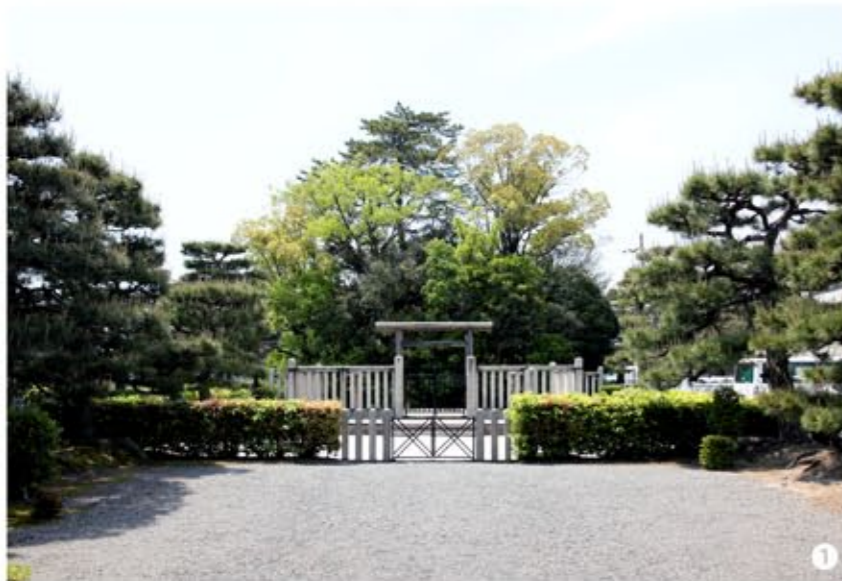
1 駅から近く分かりやすい場所にあり、第二京阪道路の高架の真下にある。

七一代 後三條天皇の第一皇子。白河天皇は先帝の意思をついで、政治の中心から藤原氏をしめだすことに成功する。これにより、繁栄を極めた藤原氏は没落していく。その後、白河天皇の自身が政治の実権をにぎり、思うがままの政を行うことになる。退位後も上皇となり院政をひいた、はじめての天皇。また、武士と結びつくことで源氏や平氏が力を持つようになりはじめる。天皇・貴族から、武士の政への道筋となっていた。貴族時代であった平安時代が終わり、武士の時代へと進んでいった。白河天皇は自身の死後は上葬されるように命じたという。崩御時にはまた遺骨を納めるための「成菩提院」が落成していないため、衣笠山の山麓で茶毘に付され「香隆寺」に一次的に埋葬した。そして天承元年(一一三一年)成菩提院に遺骨を改葬した。