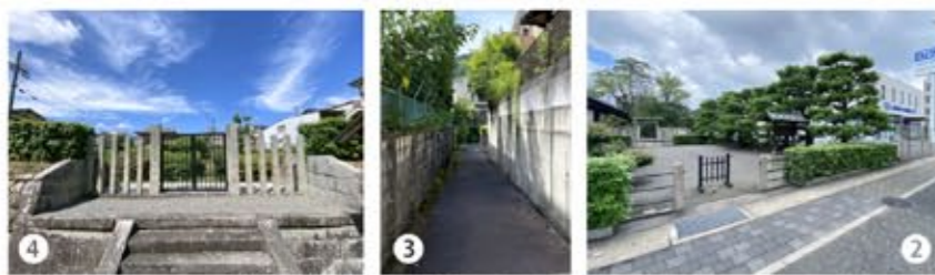
2 御陵拝所の入口。3 4 市道183号線(きめかけの路)から北向きに斜めの道を50mほど進む、左手に路地裏のような細い道がある。これを勇気を出し進めば火葬塚だ。