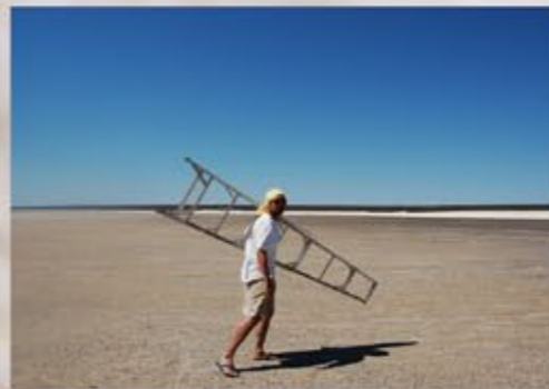
余りにも広いため、被写体に厚みを持たせたいため現地で借りた脚立を遠浅の沖まで運ぶバカがいる(今ならドローンで撮影できる)。

西オーストラリアの世界遺産シャーク・ベイの「シェルビーチ」 パースから700kmほど北に位置する、 小さな貝殻で埋め尽くされた遠浅の海岸。