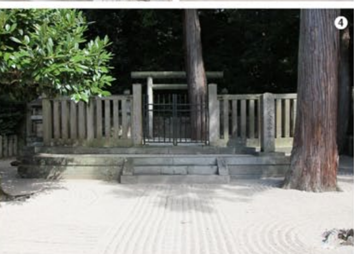
① 四国八十八箇所・第八一番札所の「白峯寺」門前、弘法大師像を入れて一枚。②③④ 参道を行けば、拝所へ向かう石段の登り。この位なら楽だ〜！怨霊になった天皇だと言われているが、お優しいお方です。拝所、御陵ともに手入れが行き届いている、大切に祀っていることがよく分かる。