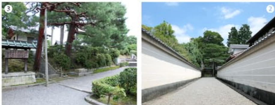
2 3 「三十三間堂」を通り過ぎ、「養源院」と「法住寺」の間の道が拝所へ向かう参道だ。この道の入口に鉄門があり平日のみ開いている。突き当たりに宮内庁の案内板、右に行けば拝所。