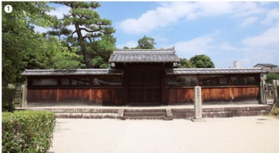
1 後白河天皇の御陵だから、もっと凄いのを想像していたが拍子抜けだ(また不敬だ・笑)。

その御陵は、木曾義仲によって焼き討ちされた「後白河法皇の御所・法住寺」跡にある。その「法住寺」は後白河法皇の御陵を守る寺として江戸時代末期まで続いたが、明治に御陵と寺が分離されてしまった。