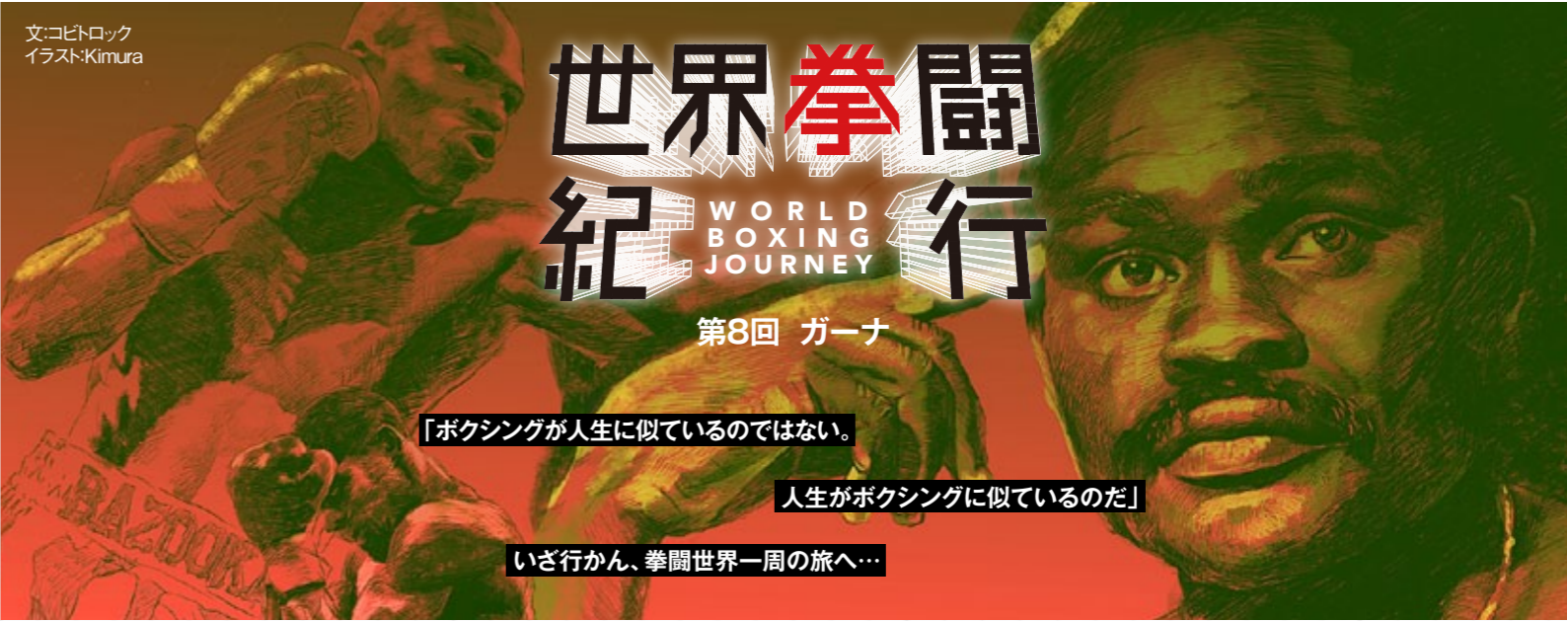
文:コヒトロック イラスト:Kimura