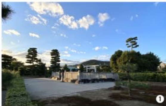
1 2 参道を50mほど進めば拝所に到着、中の敷地は思ったより広い。斜光が御陵にあたりいい感じだ。

先帝・後白河天皇の第一皇子。祖父である七四代・鳥羽天皇(法皇)の皇后藤原得子(美福門院)に育てられ出家する予定だったが、七六代・近衛天皇の崩御に伴い鳥羽法皇の強い意向によって皇位継承者となる。その後、後白河天皇の即位とともに親主吉下を受け、立太子となった。しかし、この事柄を叔父の七五代・崇徳天皇(上皇)らのが不満に思い、一一五六年「保元の乱」と流れていく。一一五八年、後白河天皇から譲位を受け一六歳で即位、第七八代、一条天皇となった。その翌年、「藤原信賴・源義朝」により「平治の乱」が起こり、一条天皇は御所に幽閉された。これを「平清盛」が救い出した。父の院政を嫌い親政を敷いたが、一三歳の若さで崩御した。その御陵は、「香隆寺」の野で火葬されたのち「香隆寺本堂」に遺骨が納められて、その後「香隆寺本堂」から境内に遷宮された。「三昧堂」に改葬される。この「香隆寺」は山緒ある寺院だったが、鎌倉時代以降に廃絶して、その正確な位置は不明となった。現在の京都市北区の衣笠山から船岡山一帯と推定があり、明治三年に、その跡地を推定して、一条天皇香隆寺陵が造られた。