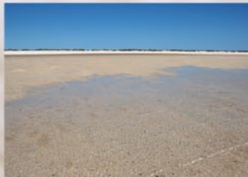
遠浅のシェル・ビーチを撮影機材を持って沖まで歩いた。海は限りなく透明で、貝殻の干潟が永遠と続いた。

この台風が過ぎ、秋晴れの日には旅にでるつもりだ! この歳になっても旅の前日はワクワクする。