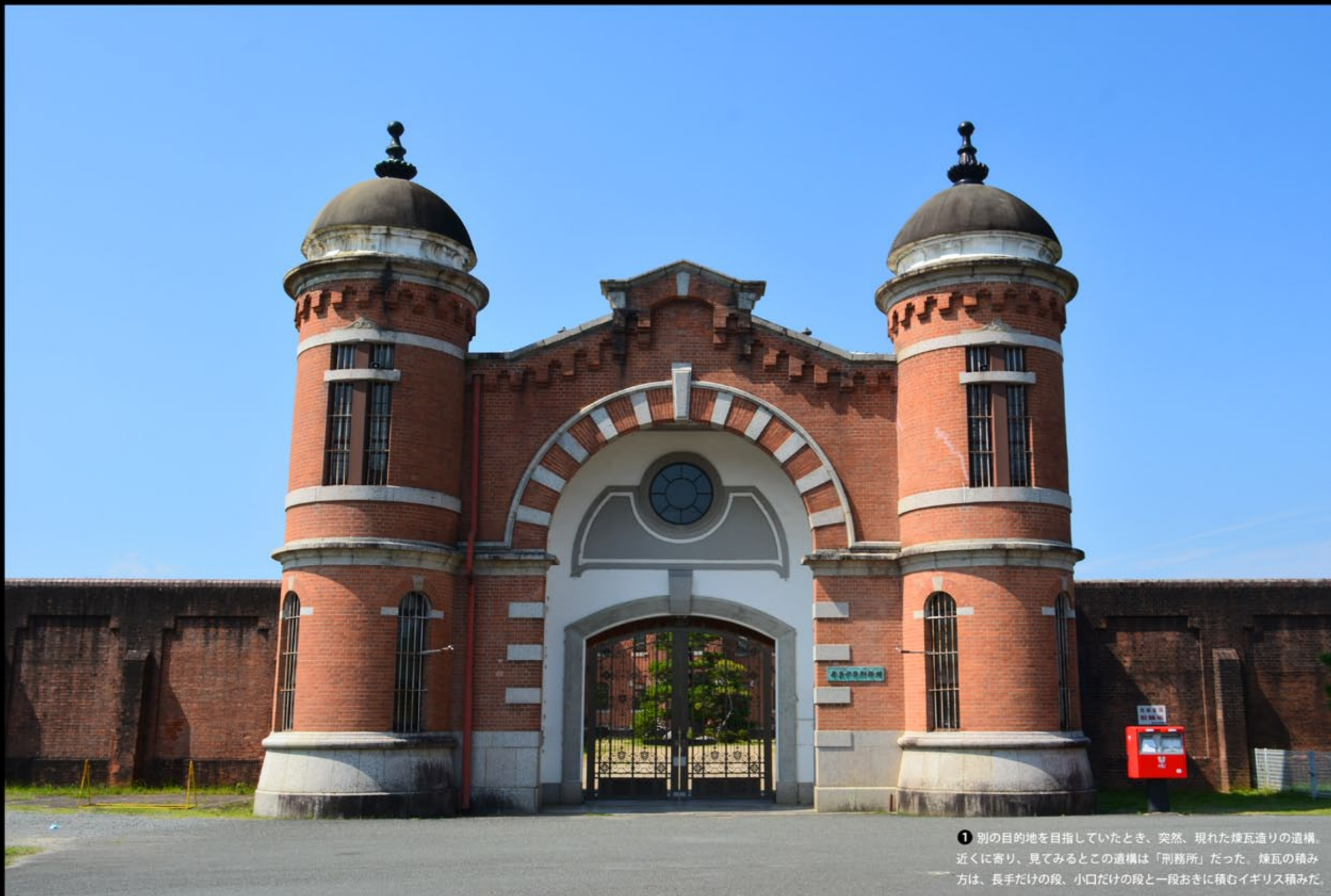
① 別の目的地を目指していたとき、突然、現れた煉瓦造りの遺構。近くに寄り、見てみるとこの遺構は「刑務所」だった。煉瓦の積み方は、長手だけの段、小口だけの段と一段おきに積むイギリス積みだ。

旅をしていると、これぞと思う建造物に出会う。それは、駅舎、私邸、公共施設でもある。その時代の栄華、繁栄を知らしめしこの時代にも、その美意識は生き続けている。先人たちが、造り、使い、残した、『匠の舎』