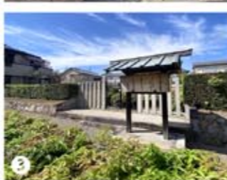
② 住宅街から火葬塚側面に向かう、細い細い参道があった・・・