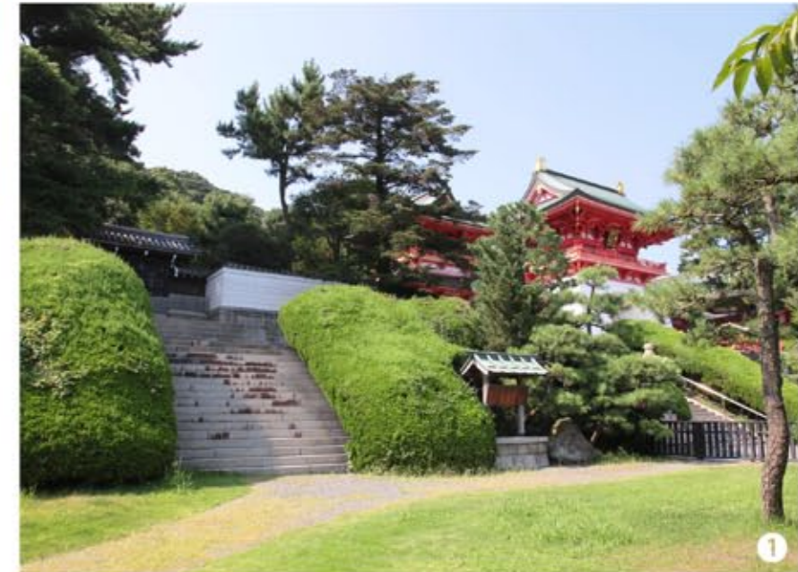
1 赤間神宮正面「水天門」の向かって左横に御陵拜所がある。

八一代 安徳(あんどく) 天皇陵 諱 言仁(ときひと) 在位年 西暦二一八〇〜二一八五 陵形 円丘 皇居 福原宮(神戸市兵庫区) 所在地 阿弥陀寺陵 山口県下関市阿弥陀寺町 最寄駅 山陽本線「下関」下車、バスで「赤間神宮前」下車すぐ 祖父にあたる「平清盛」の力により、生後まもない「八〇代・高倉天皇」の第一皇子(母は平清盛の娘の徳子)を立太子。その約一年後、朝廷内の反感をかいつつも「八一代・安徳天皇」が即位。 「平清盛」の死後、平家滅亡と共に僅か六歳で命を落とした悲劇の幼帝である。歴代の天皇の中、最も短命の上に、戦乱で落命した唯一の天皇。 また、平家一門と「都落ち」をすると、朝廷では「八二代・後鳥羽天皇」が即位。正史上初めて同時に二人の天皇が擁立された。その御陵は、山口県下関市の関門海峡を目の前にした「赤間神宮」境内にある。壇ノ浦の戦いより一年後、「源頼朝」の命により「安徳天皇の怨霊」を鎮める目的のため「阿弥陀寺御影堂」が建てられた。その後も、「安徳天皇の怨霊鎮慰」のため、木彫の等身大尊像が造られ本殿に収められ、現在の「赤間神宮・本宮」ご神体となっている。