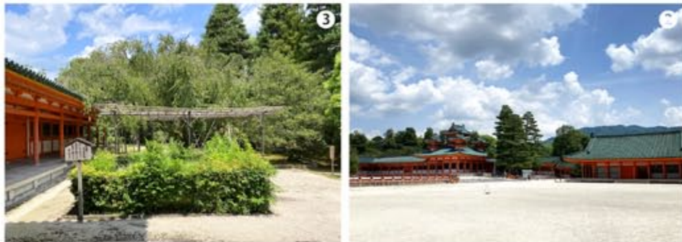
2 3 もう一つの御陵がある「平安神宮」。なんと言っても宮内庁が管轄しているのだから、ここは勝手に見ることはできない、平安神宮社に声を掛けて見せてもらった。

七二代 白河(しらかわ)天皇陵 諱 貞仁 しらかわ 在位年 西暦一〇七二(一〇八六年) 陵 形 方丘 皇 居 平安京(京都市上京区)