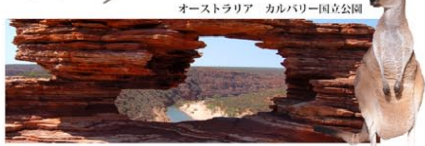
オーストラリア カルバリー国立公園