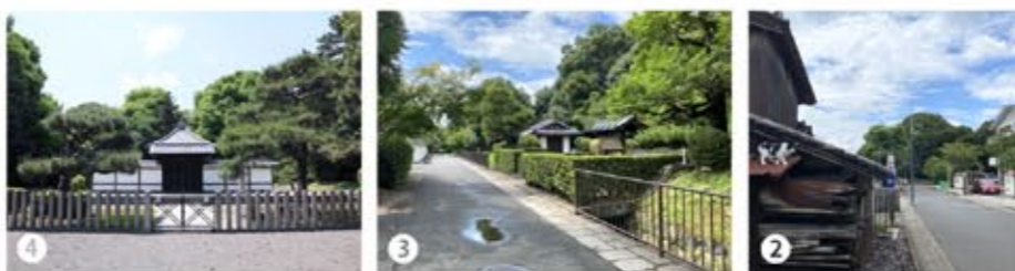
② 御陵の手前で招き猫が現れた、奥が鳥羽天皇陵だ。③④ 先ほどの道よりくると回れば、御陵拝所だ。参道も美しく整備されている。