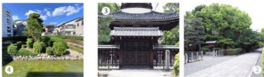
2 3 安楽寿院の土堀沿いに歩けば、すぐに見慣れた宮内庁の表示板。さすがは秀頼公の再建だ。豊臣好みの派手さがある気がした。 4 細い道を10mほど行けば、袋小路に火葬塚だ。住宅地だが、綺麗に整備されている。

七七代 後白河(このしろかみ) 天皇陵 諱 雅仁 まさひと 在位年 西暦一一五五〜一一五八年 陵 形 方形堂 皇 居 平安京(京都市上京区)