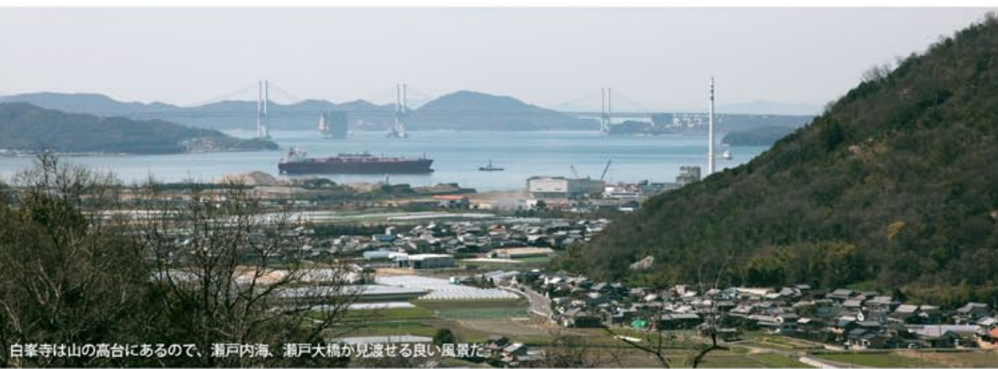
白峯寺は山の高台にあるので、瀬戸内海、瀬戸大橋が見渡せる良い風景だ。