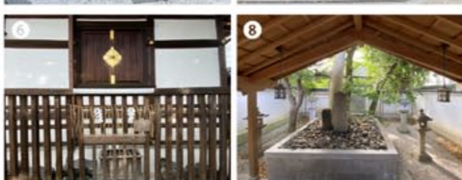
⑤⑥ 縁切り神社として有名な安井金毘羅神社、主祭神として崇徳天皇をお祀りしている。⑦⑧ 「安井金毘羅神社」の北側、徒歩約1分に「崇徳天皇廟」がある。門の隙間からの1枚。