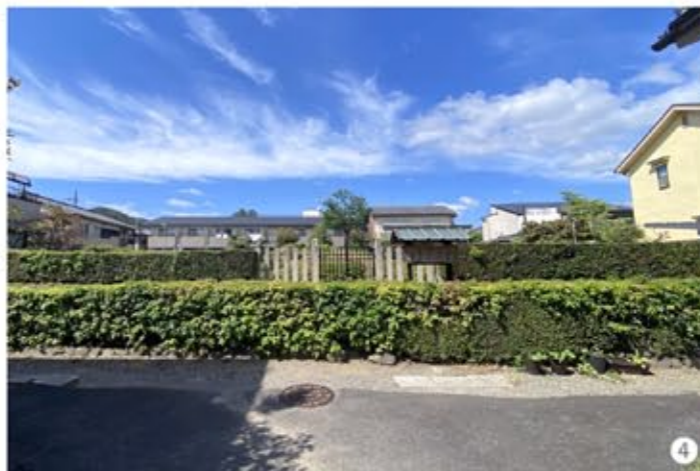
③④ 民家の間を抜けると火葬塚が右手に現れた。火葬塚は京福電鉄北野線「北野白梅町」から、約450m・徒歩約6分で駅近くで訪問しやすかった。