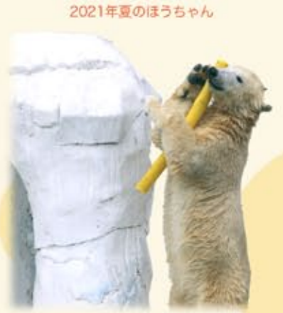
2021年夏のほうちゃん