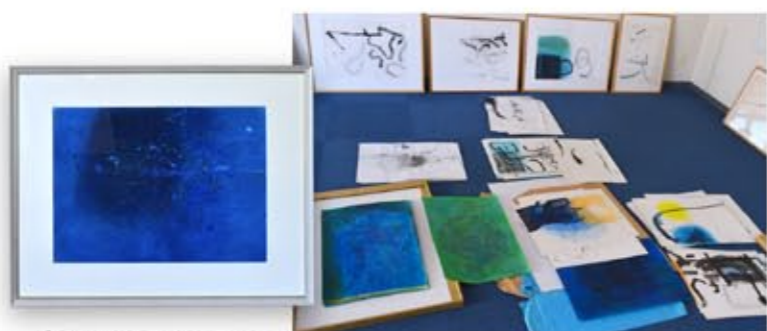
「ブルー」の絵を見るときは顔して頂いて、ピカソの「青の時代」を思い出さず。