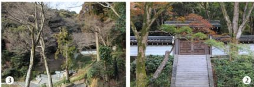
1 2 拝所の正面、階段上にあるのが後清閑寺陵(80代高倉天皇陵)。 3 清閑寺陵(六条天皇陵)を確認するため、横の「清閑寺」に行くが拝所に向かう階段しか見えなかった。残念だが、ここから通拝することにした。 4 ただひたすら国道一号線沿いを歩けばいい。目印は公益社・中支店。