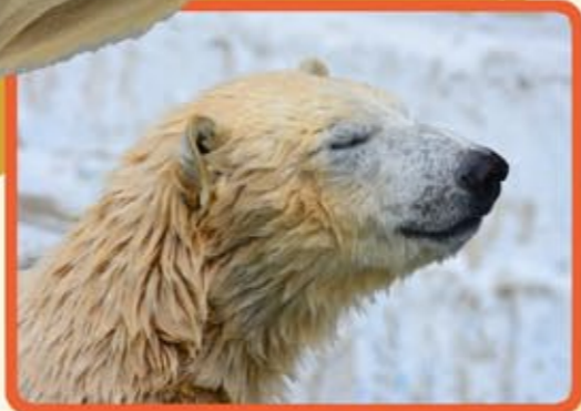
一年前のお顔は きれいね！ 少しずつ大人に なってきているね