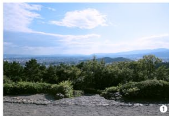
① 六六代・一条天皇陵と同域である朱山からの眺め。この両御陵からの景色はいい！ 訪問も一石二鳥だ！

七三代・堀河天皇は、七二代・白河天皇の第二皇子。先帝が八歳の善仁親王に皇位を譲り即位させた。幼い天皇を支えるため関白・藤原師通に法皇の権限を抑え、政を行っていた。しかし藤原師通が亡くなると、先帝の白河上皇が再び政を行い、次第に堀河天皇は政への関心を失っていった。政に関心を失った天皇は、情熱を趣味の音楽や和歌などに傾けるようになった。その後、堀河天皇の第一皇子(七四代・鳥羽天皇)を、白河法皇が引きとって、院で育てはじめた。白河法皇に翻弄され続け、二九歳で崩御する。その御陵は、六六代・一条天皇陵と同域である朱山・龍安寺内にある。