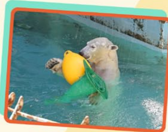
おもちゃは2個持ちが好きなんですしゅ。