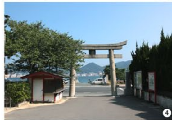
2 3 幼帝の御陵にしては立派だ、平家の落人が寄進して祀ったのか、それともやはり崇りが恐ろしい源氏一門が築いたのか・・・ 4 赤間神宮から見渡せる関門海峡「壇ノ浦」。この海の底に、三種の神器のひとつ「草薙の剣」が眠っていると考えると、御陵がこの場所にあるのが必然だ。

八一代 安徳(あんどく) 天皇陵 諱 言仁(ときひと) 在位年 西暦二一八〇〜二一八五 陵形 円丘 皇居 福原宮(神戸市兵庫区) 所在地 阿弥陀寺陵 山口県下関市阿弥陀寺町 最寄駅 山陽本線「下関」下車、バスで「赤間神宮前」下車すぐ 祖父にあたる「平清盛」の力により、生後まもない「八〇代・高倉天皇」の第一皇子(母は平清盛の娘の徳子)を立太子。その約一年後、朝廷内の反感をかいつつも「八一代・安徳天皇」が即位。 「平清盛」の死後、平家滅亡と共に僅か六歳で命を落とした悲劇の幼帝である。歴代の天皇の中、最も短命の上に、戦乱で落命した唯一の天皇。 また、平家一門と「都落ち」をすると、朝廷では「八二代・後鳥羽天皇」が即位。正史上初めて同時に二人の天皇が擁立された。その御陵は、山口県下関市の関門海峡を目の前にした「赤間神宮」境内にある。壇ノ浦の戦いより一年後、「源頼朝」の命により「安徳天皇の怨霊」を鎮める目的のため「阿弥陀寺御影堂」が建てられた。その後も、「安徳天皇の怨霊鎮慰」のため、木彫の等身大尊像が造られ本殿に収められ、現在の「赤間神宮・本宮」ご神体となっている。