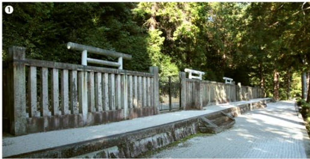
1 日が差し込んだので下手側より、三代天皇陵を一枚に納めた。

即位後には、摂関家藤原氏に独占されていた要職に「大江匡房」や「源師房」らを登用するなどして、関白・藤原氏を抑えた。また「莊園整理令」の発布「延久官目掛」の制定などの新たな改革を進めた。後三條天皇の治政は、天皇親政による朝廷に「大きな影響力」を持つようになった。