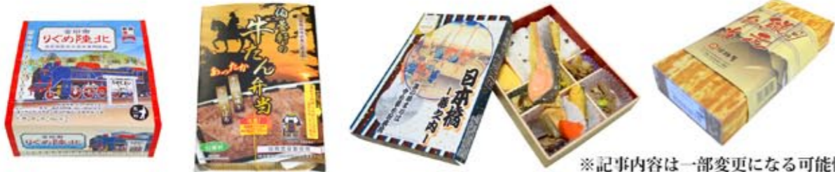
※記事内容は一部変更になる可能性があります。

鉄道開業150年記念弁当・御辯當北陸めぐり、 伯養軒のあったか牛たん弁当、井筒屋行楽弁当、 六甲縦走弁当、日本橋幕の内、その他