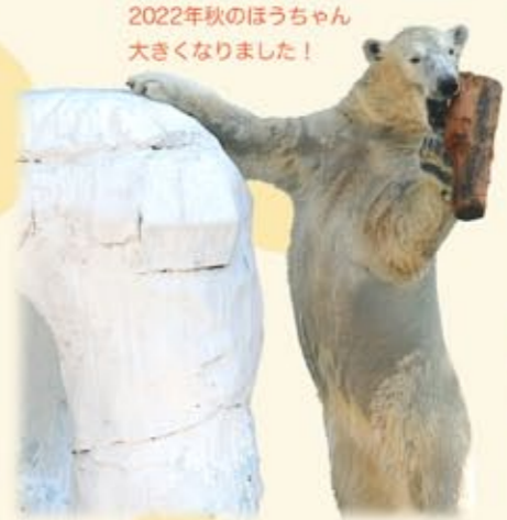
2022年秋のほうちゃん 大きくなりました！