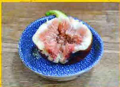
忙しいときの「これ、食べといて」

秋を感じさせてくれる優しい(限定酒なので、笑)お酒には、くせの強い大好きな「ごぼう天ぷら」を合わせるのだ。写真を見れば分かると思うが、良くある細い細い箸掻きごぼうの様な天ぷらじゃない！直径約一センチ以上ある本気のごぼうなのです。下ごしらえに薄口の出汁で炊き、水分を切ってから揚げる、だから天ぷらなんて要らない。そのまま食べれば、野性味のある土の味だ(笑)、味変様に粗塩を付けてくれる。また、色つけにかかっているアオサ海苔の風味とごぼうが良く合う、大地と水域のコラボレーションだ。