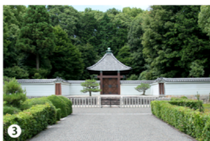
③ 何度もきた深草北陵もこれが最後だと思えば・・・、嬉しい〜。