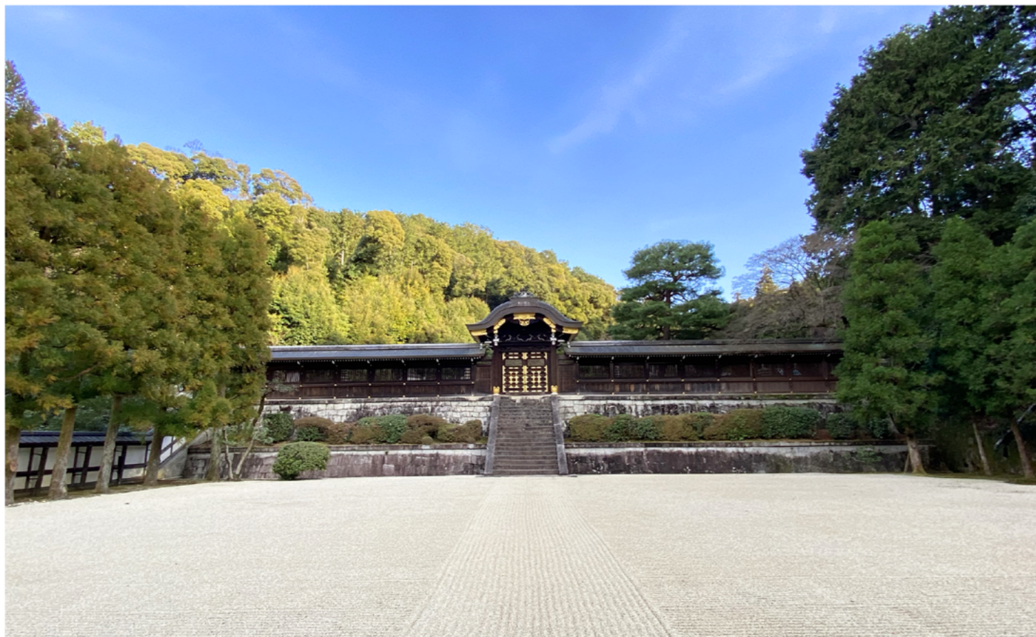
13代もの天皇が眠る「月輪陵」だ・・・。108代・後水尾天皇、109代・明正天皇の御陵、この後も続いていく・・・。