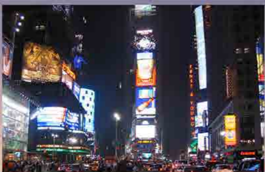
日本の「甲」がまだ残った頃の「タイムズスクエア」。その頃は日本カップスターの広告が輝いている。

そうして、平成四年(一九九二年)春に「野宿徒歩旅」の道具をリュックに詰め込みスタートを切った。隣りに「M氏」が歩いている、一抹の不安を抱きながらのスタートだった。