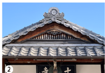
① ② 菩提寺勅願所「十禅寺」は戦火により荒廃したが、1655年、霊夢を見た「明正天皇」によって再興された。JR「山科」より直ぐ。