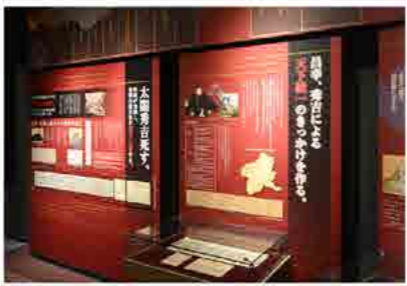
三津の川の渡しは「六文」、ミュージアム入館料「500円」。

時計を見れば午後三時、そろそろ「九度山駅」に向かわなければ台風の影響を受けそう。少し小降りになった隙を見て、忍者の如く「真田ミュージアム」を後にした。三時半の電車で飛び乗り帰路に着く途中、車内アナウンスでこの後の「高野山から橋本駅・計画連休」を聞き胸をなで下ろした（苦笑）。ああ、途中下車でよかったです。ご先祖様がお守りしてくれました。 旅行中の危機管理はしっかりと、楽しい時間を過ごしましょう。