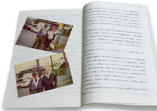
送って頂いた「闘病記・もう一度の努力を」と記念写真。旅から10年くらいはハガキのやり取りがあった、その後はどうしていらっしゃるのか。この便利な時代でも分からない、もう一度お会いしたいです。