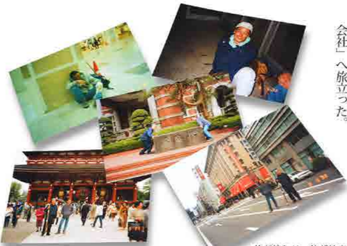
旅が終わり、旅が始まる。ありがとう、君に。ありがとう、自分に。

五月八日早朝「多摩川上手」からスタート。「東京駅・八重洲口」まで約一八キロの距離、午前中のゴールを目指し歩く。蒲田を越えた辺りから「M氏」の様子がおかしい「足が痛いのか？」と聞いたが違うみたいだ。気にせず歩くことにするが、やはり遅れがちの「M氏」にもう一度聞けば「腹が痛く、もう限界！先に進んでくれ」と言い何処かに消えた。置いていくこともできず、その場で暫く待つと姿を現した。「何処でどうしたか」など野暮なことは言わず前に進んだ。今のよう