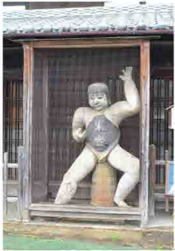
集落の道沿いに行む、焼き物の「米金の金時像」 上・「道の駅」横の「観光案内所」、高野山の説明が詳しく書かれた展示物がある。下・真田の抜け穴伝説の「真田古墳」???

集落を抜け、雨で滑る坂を降れば県道一三号線沿いに出た。「グラタン・カフェ」は目の前だ、「丹生川」のほとりに立つ店舗、入り口は県道から川底に降りるようになっていて、県道と川底の間くらいにホール（客席）があり、晴れた日なら川沿いのカウンター席がオススメ、川の流れる眺めながら熱いグラタンを食べるのもいい。メニューには、もちろん「グラタン」のみ！ 選んだのは、贅沢にここで一番高い（笑）、「海の幸・海鮮グラタン」にした。そのお味は濃厚