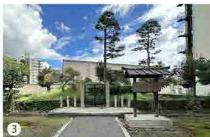
3 京都府京都市上京区堀川通上御霊前扇町にある火葬塚。