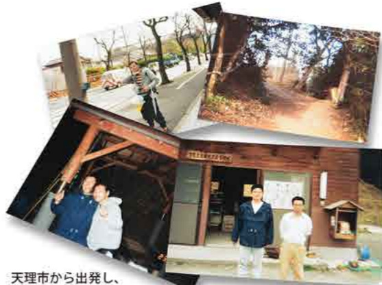
天理市から出発し、怪しげな獣道を彷徨い、親切な町の方に救われた「バカ2人」です。ありがとうございました!

キャンプ場」のログハウスを使えば良い」と親切に案内をしてくれカギを開けてくださった。本当に今でも萩町役場の方々に感謝しています! この日の歩行距離はたったの約一七キロで終わった・・・。