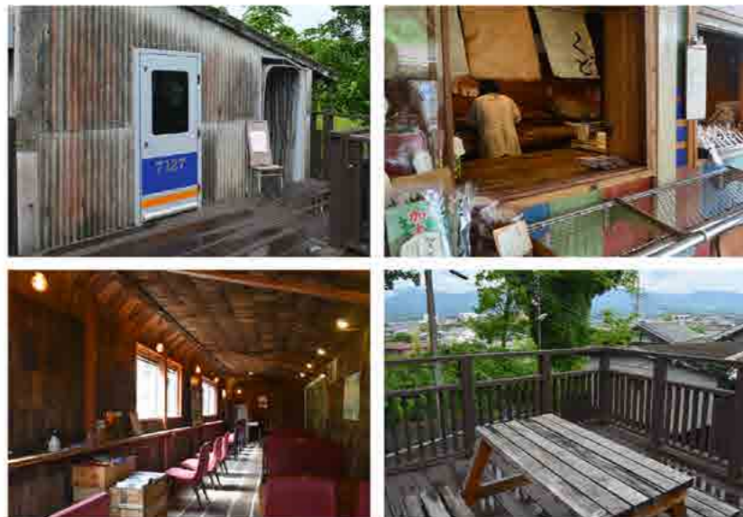
対岸ホームの売店を覗いてみると？ おにぎり屋さん「くど」だった。また、おにぎりは並んでないけど(笑)。「くど」様、横内に併設されている「展望スペース」と「屋内休憩所」の中はまるでおしゃれなレトロ調カフェです。入口のドアは車両ドアを利用している！ 鉄ちゃん、鉄子にも喜ばれそうなフリースペースです。

「くど」という名前のおにぎりや和歌山物産店だった。買い物をしてきたお客さんに聞いてみると「予約していたお弁当を取りにきたんですよ。この和歌山県産の食材を使った、お弁当、おにぎりがとても美味しくて。」と教えてくれた。そう聞けば「買わねばならぬ」と人気のおにぎりを購入した。お昼前でお店の中にある厨房？ は大忙しの状態、少し待っておにぎりを受け取った。どこで食べようか？ 考えていたら、スタッフの方が横(構内)に休憩できるイトインコーナーがあると案内してくれた。 お店の横にある階段を登れば、ウッドデッキのある「展望スペース」、その奥には南海電車のドアを取り付けている「屋内休憩所」がある。小雨が降ってきたので「展望スペース」はパスして、「屋内休憩所」でおにぎりを頬張った。 ※おにぎりは是非食べてください、これ本当に美味しいです！ あまりの美味しさに写真を撮り忘れた・・・(苦笑)。窓の外を見ると小雨も上がったようなので、改札を出て駅前の観光案内表示をチェックして歩き出すことにした。