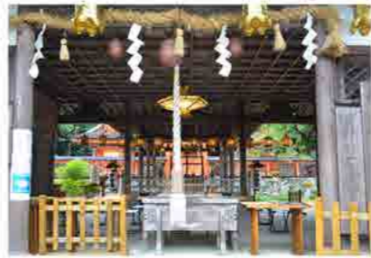
石段、119段・・・途中、昇った車を後倒した。上り詰めた先は「多宝塔」の奥に何やら階段がある、気になる・・・。「丹生宮符神社」。ここにも高野山案内犬と大師さまが登場した。