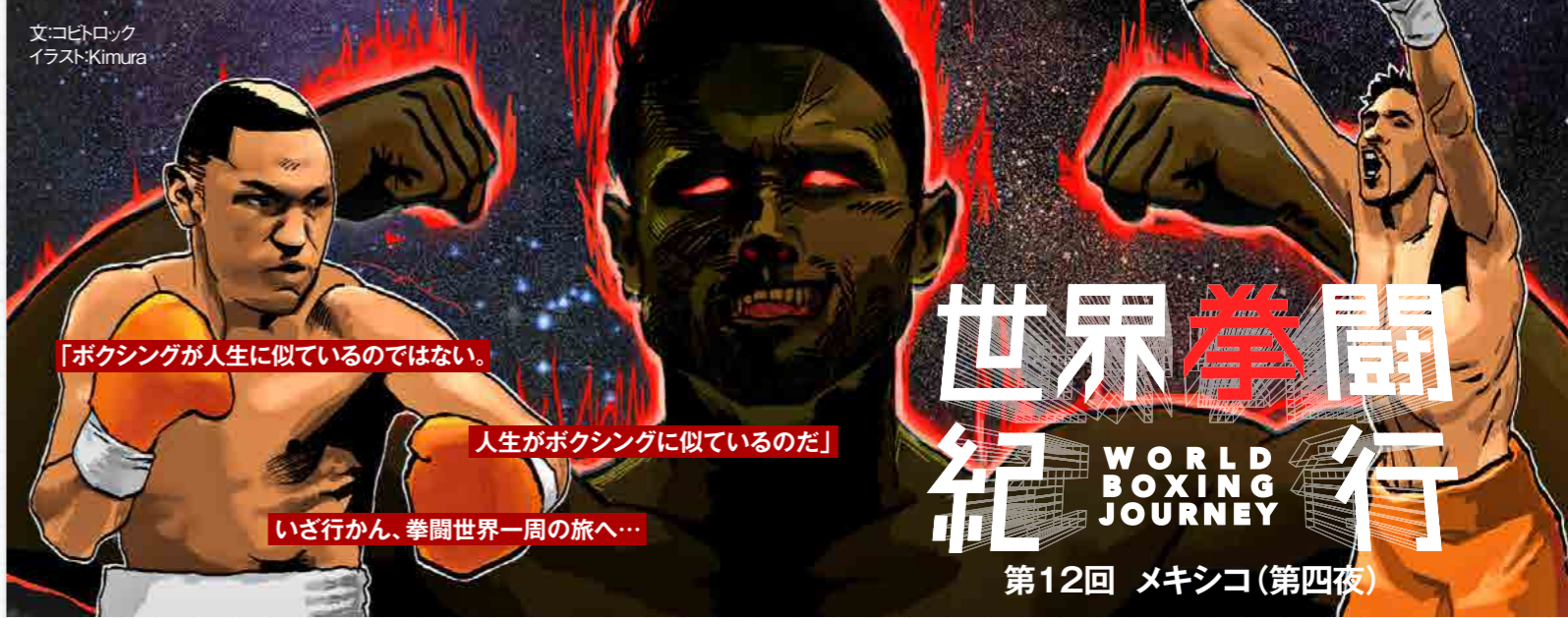
文:コビトロック イラスト:Kimura

そして現在にいたる 第12回メキシコ2000年代以降2。本日は前回でメキシコ編を終わらそうかと思っていたのだが、もう大好きなマルケス・バレラ・モラレスについて書き出したら止まらなくて、その3人だけで埋まってしまうわ。という訳で前回に引き続きメキシコ編を好き勝手に。