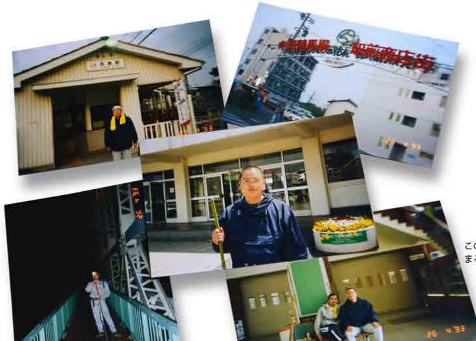
この日より「M氏」は坊主になった、まるで修行僧の如く(笑)。

〇キロを単独歩し一五時前に「M氏」と合流、すると彼は帽子を脱ぎ頭を見せた。なんと! 丸坊主になっている! 丸坊主といえど髪が野球部以外に生えつかなかったのが悔しく、自戒を込めて丸坊主にした」と・・・失礼ながら疲れも忘れ、ただ爆笑だった(笑)。この日の歩行距離は「名鉄・宇頭駅」まで約四七キロ。