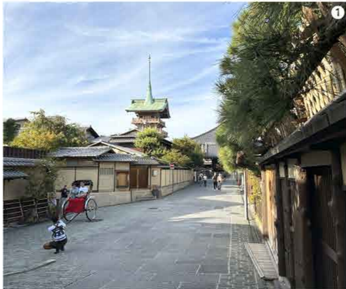
1 正親町天皇勅令により開山された「大雲院・大雲院跡」が見えた。

その御陵は、「深草十二帝陵」とも称されている深草北陵。また、京都市東山区今熊野泉山町の泉涌寺内「月輪陵」には「灰塚」がある。