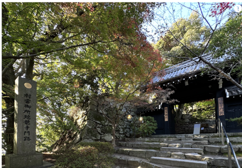
① 瑞龍寺(後陽成天皇勅願寺)、JR琵琶湖線・近江八幡駅を降り、八幡山ロープウェイで到着。

その御陵は京都市伏見区深草坊町にある「深草北陵」で、京都市東山区今熊野泉山町・泉涌寺内「月輪陵」には「灰塚」がある。