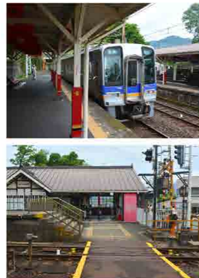
南海高野線「九度山駅」に途中下車。駅は「真田の赤備え」のイメージで演出されている。向かいのホームにかわいい売店？ 対岸ホームには線路を横切り向かいます、何やら秘蔵品みたいだ！

「くど」という名前のおにぎりや和歌山物産店だった。買い物をしてきたお客さんに聞いてみると「予約していたお弁当を取りにきたんですよ。この和歌山県産の食材を使った、お弁当、おにぎりがとても美味しくて。」と教えてくれた。そう聞けば「買わねばならぬ」と人気のおにぎりを購入した。お昼前でお店の中にある厨房？ は大忙しの状態、少し待っておにぎりを受け取った。どこで食べようか？ 考えていたら、スタッフの方が横(構内)に休憩できるイトインコーナーがあると案内してくれた。 お店の横にある階段を登れば、ウッドデッキのある「展望スペース」、その奥には南海電車のドアを取り付けている「屋内休憩所」がある。小雨が降ってきたので「展望スペース」はパスして、「屋内休憩所」でおにぎりを頬張った。 ※おにぎりは是非食べてください、これ本当に美味しいです！ あまりの美味しさに写真を撮り忘れた・・・(苦笑)。窓の外を見ると小雨も上がったようなので、改札を出て駅前の観光案内表示をチェックして歩き出すことにした。