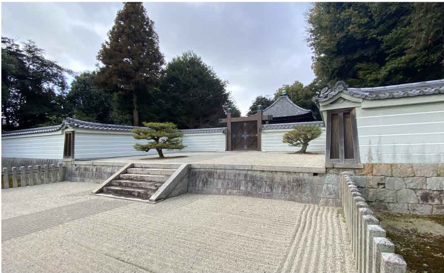
104代 後柏原天皇陵、105代 後奈良天皇、106代 正親町天皇陵が眠る「深草北陵」。別名「深草十二帝陵」。