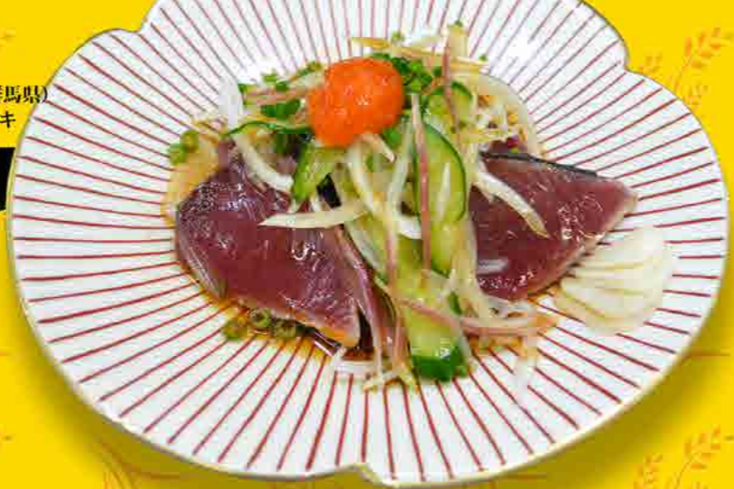
酒/群馬県 山廃純米 (群馬県) 肴/戻りカツオのタタキ