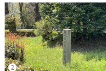
① ② 後水尾天皇の頭髪や歯を奉る「相国寺・後水尾天皇髪歯塚」に訪問。京都市地下鉄「今出川」から徒歩約7分。

そのため「一〇八代・後水尾天皇」は生涯幕府に対する抵抗の姿勢を崩さず、退位後も四代の天皇の後見人として、五年の長きに渡り院政を敷き幕府を牽制する人生を歩む。五五歳で出家したのち八五歳で崩御、当時の天皇としては異例の長寿だった。その御陵は「泉涌寺」内の「月輪陵」に葬られている、また京都市上京区の「相国寺」境内には毛髪や歯を納めた「後水尾天皇髪歯塚」も奉られている。