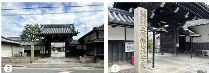
1 2 後奈良天皇勅願寺「本禅寺」。ここは1406年、法華宗陣門流の門祖「日陣」によって創建されたお寺だ。

その御陵は、「深草十二帝陵」とも称されている深草北陵。また、京都市東山区今熊野泉山町の泉涌寺内「月輪陵」には「灰塚」がある。