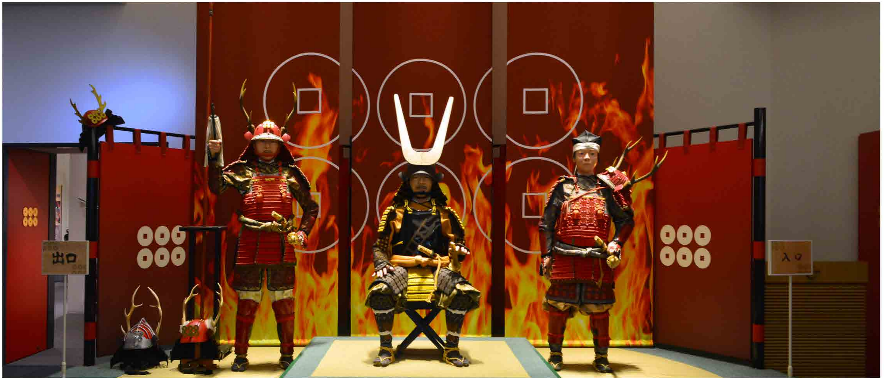
エントランスロビーには真田三代が持ち構える「真田ミュージアム」