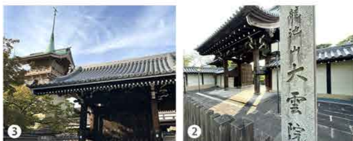
2 京阪本線・祇園四条より八坂神社を左手に歩いて15分大雲院に到着。 3 駅より「ねねの道」に向かう途中にある山門、ここからは入れない。

一〇四代 後柏原(こかしわばら)天皇陵 諱 勝仁 かつひと 在位年 西暦一五〇〇〜一五二六年 陵 形 方形堂 皇 居 平安京(京都市上京区)