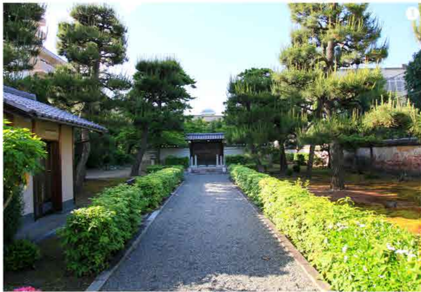
1 後土御門天皇分骨所には京都市営地下鉄「今出川」から約1,7kmで徒歩25分。

乱の終結後、朝廷儀式の復興を望むが、思うように行かなかった。明応九年(一五〇〇年)に御所の黒石にて崩御。葬儀の費用に乏しく、四〇日も御所に遺体が置かれたままと伝えられている。その御陵は、「深草十二帝陵」とも称されている深草北陵。また、遺骨の一部は、父の「後花園天皇」と同所の京都市上京区「般若院陵(はんしゅういんのみささぎ)」に分骨されている。