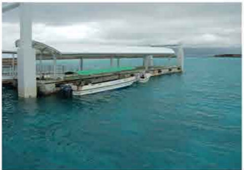
沖縄県 鳩間島棧橋

ソノひびヨリ 連載 第三〇話 奈良県・飛鳥 ライトに古墳・万葉飛鳥一日観光 第三一話 沖縄県・西表島 真冬の南国はやはり曇天だ