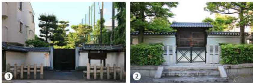
2 廟の扉にはもちろん「菊の御門」、ここから来たので中の様子が知りたかった。 3 朝、門が閉まってた、立札を見れば九時からの開門だ、胸を撫で下ろした。

一〇六代 正親町(おおきまち)天皇陵 諱 方仁 みちひと 在位年 西暦一五五七〜一五八六年 陵 形 方形堂 皇 居 京都御所