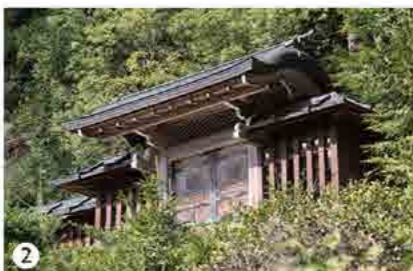
2 山に張り付くように見える御陵。少し見上げるように参拝した。

所在地 後山園陵 京都府京都市右京区北井戸町丸山 常照皇寺内 最寄駅 JR京都駅より車（レンタカー）で、約三七キロ、所要時間約一時間一〇分。 先帝の「称光天皇」が嗣子を残さず崩御、そのため一四二八年に「二〇二代・後花園天皇」として即位する。本来は皇統を継ぐ立場にはなかった「後花園天皇」。先帝・称光天皇「危篤に陥ると、「兩統迭立」を要求する南朝寄りの勢力が動き出す気配を見せはじめた。その動きを抑えるため、室町幕府次期將軍の「足利義宣（足利義教）」は「彦仁王（後花園天皇）」を保護し、院政を敷く「後小松上皇（二〇〇代天皇）」に対して新帝指名の圧力をかけ誕生した。「後花園天皇」と「先帝・称光天皇」は八親等以上離れた続柄。「四八代・称徳天皇」から「四九代・光仁天皇」以来六五八年ぶりの皇位継承だった。 その御陵は「北朝初代・光厳天皇」が創建した、「常照皇寺」内にある。「光厳天皇陵」と同域で内庁上の形式は石造宝篋印塔とされている。