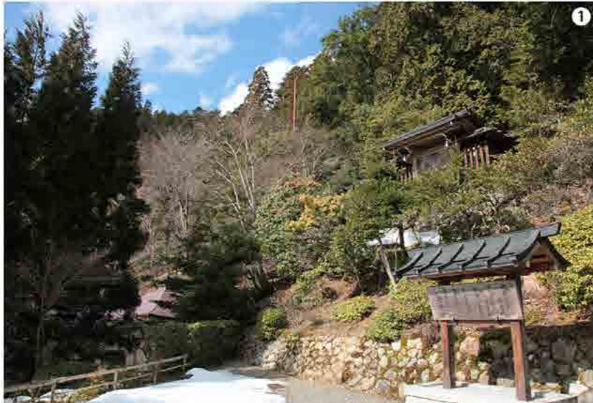
1 「常照皇寺」の山門をくぐって石段を上り、約140mほど歩けば御陵が見えた。

代、どうしたのか三〇年後の現在でも謎のまま（笑）。 そうして午前一〇時過ぎ、「東京駅・八重洲口」に到着、この旅のゴールを迎えた。到着した私たちは共に感動を味合うより、淡々として寧ろ達成できた安堵感を感じていた。ただ、目の前を通り過ぎる多くの人々の中、東京駅八重洲口には私たち二人しか居なかった。 翌日、簡単な東京観光をして、翌一日帰路につく。「M氏」の帰る場所は、現在働いている制作プロダクション、彼は「もう少し、今のところ頑張るわ」と、私は「立ち上げた新しい会社」へ旅立つた。