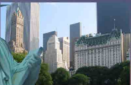
ニューヨークのオアシス「セントルパーク」。とにかく広いので歩くのに疲れた・・・。