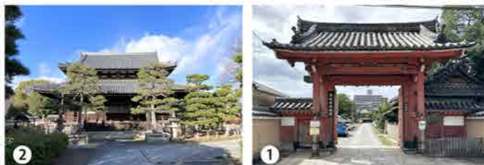
1 2 後柏原天皇の足跡を探しに浄福寺にきた。ここ浄福寺は三昧堂の建立を下賜したと伝えられている、「三昧堂」とは、専修念仏の道場だ。

一五二六年崩御。御陵は、「深草十二帝陵」とも称されている深草北陵。また、京都市東山区今熊野泉山町の泉涌寺内「月輪陵」には「灰塚」がある。