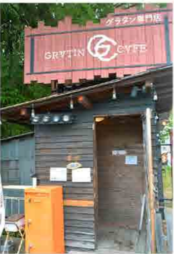
県道13号線沿いにあるグラタン専門店。その名も「グラタン・カフェ」！！ 真っ直ぐな店名です。新鮮に「海の幸・海鮮グラタン」～それとセットのサラダ、味は絶品！！

なホワイトソースは元より、ソースと生ウニとのマッチングが最高！ 濃厚に濃厚を重ねた至福の味は絶品ですよ！ 九度山オススメの一軒です、来店時には電話確認か事前予約をした方がいいです、なんて言っても人気店なのでね。予約なしで、入店できたのは奇跡らしい（笑）。